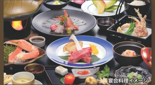
宴会料理イメージ